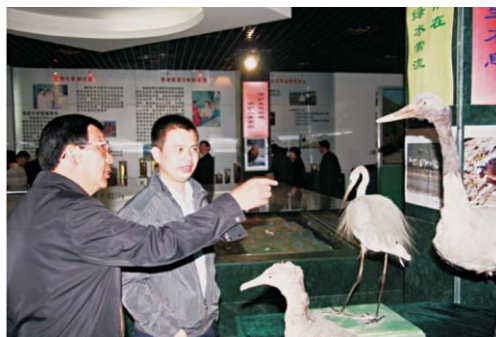
政协委员参观标本馆