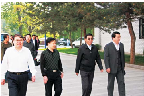
仁青安杰一行来西北高原所检查指导

5月17日上午，青海省政协副主席仁青安杰、青海省政协副秘书长范增成、青海省政协资源环境委员会主任李毅一行20余人来西北高原所检查指导工作，就西北高原所工作情况和今后的工作思路进行检查指导与座谈。