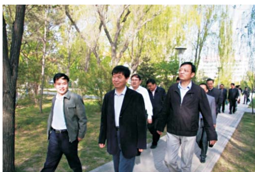
李家洋一行参观西北高原所园区建设

1.李家洋副院长视察西北高原所并参加所领导班子届中考核 5月4日上午，由中科院党组成员、副院长李家洋，人事教育局局长李和风，生命科学与生物技术局副局长苏荣辉，人事教育局领导干部处宋琦，兰州分院党组书记、副院长谢铭，兰州分院副院长杨青春，青海省委组织部正处级调研员许世臣及相关人员10人组成的考核小组对西北高原所领导班子进行届中考核。