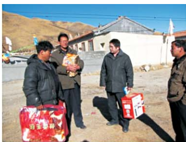
科技扶贫，服务基层