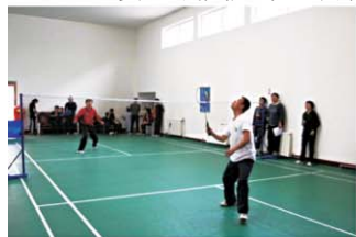
第六届“健康杯”乒羽比赛