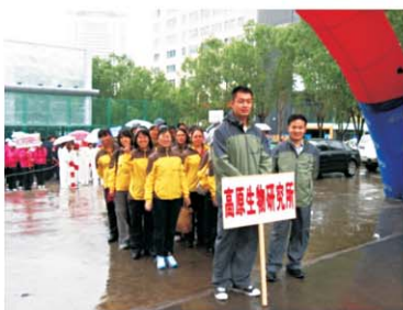
参加“省垣科技界职工运动会”