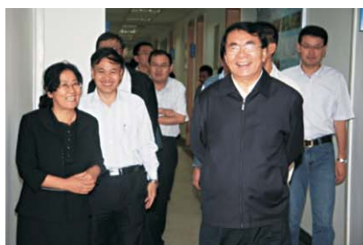
白春礼视察西北高原生物所