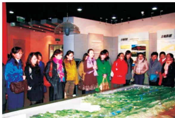
西高所女职工参观青海省国土资源博物馆

西北高原所女职工除了参加所里组织的一切活动外，还积极参与省教育工会和省妇联组织以及省委统战部组织的有关活动，今年的“三八”国际妇女节，在所党委的支持下，组织妇女们召开座谈会和参观青海省国土资源博物馆活动，使全所妇女同志愉快地度过自己的节日。