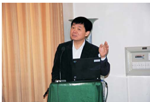
李家洋做重要讲话