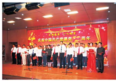
庆祝中国共产党建党90周年红歌会