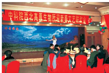
迎新春文艺联欢会