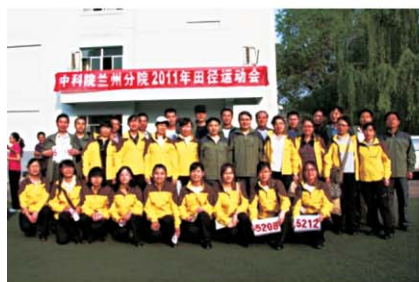
参加兰州分院田径运动会