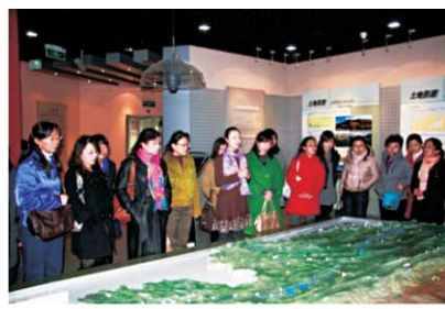
国际劳动妇女节参观青海省国土资源博物馆