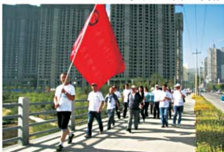
第三届“全民健身走”活动